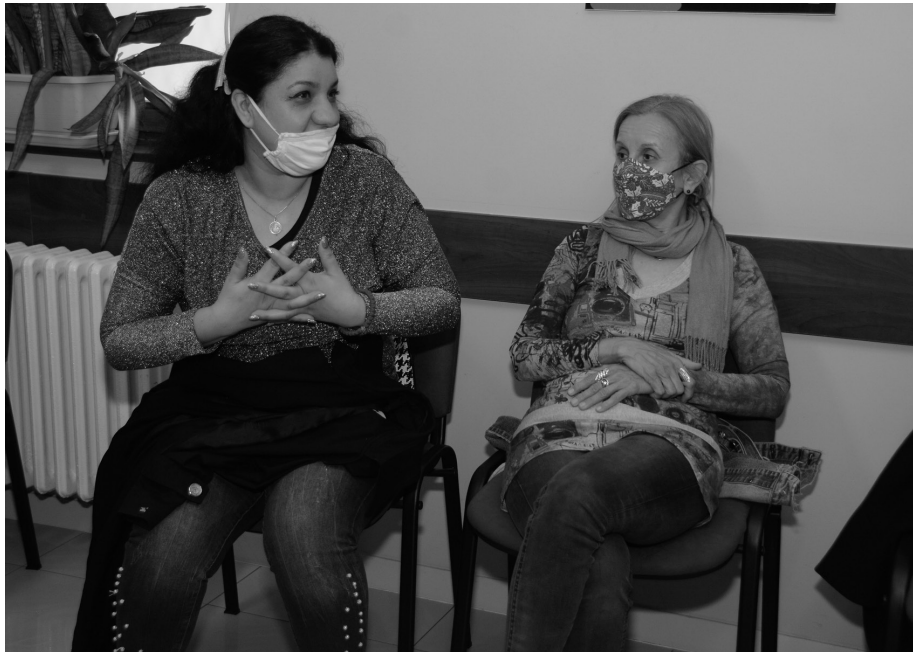
Treći konsultativni sastanak, 6. 3. 2021, Novi Sad