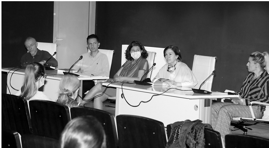
Promocija knjige „Svenka“ 8.10.2020, Novi Sad