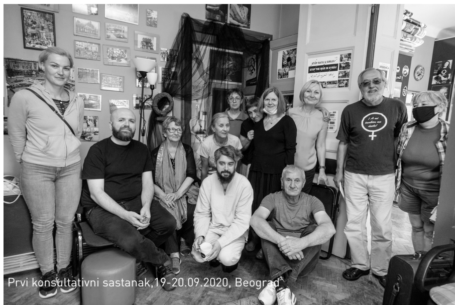
Prvi konsultativni sastanak, 19-20.09.2020, Beograd A